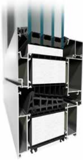
MB-104 Passive Aero