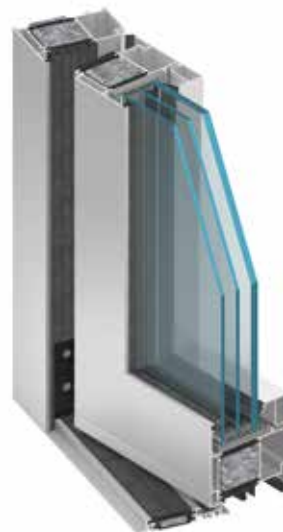
Tür MB-104 Passive SI, RC3

Beispiele für den Wärmedurchgangskoeffizienten U_D